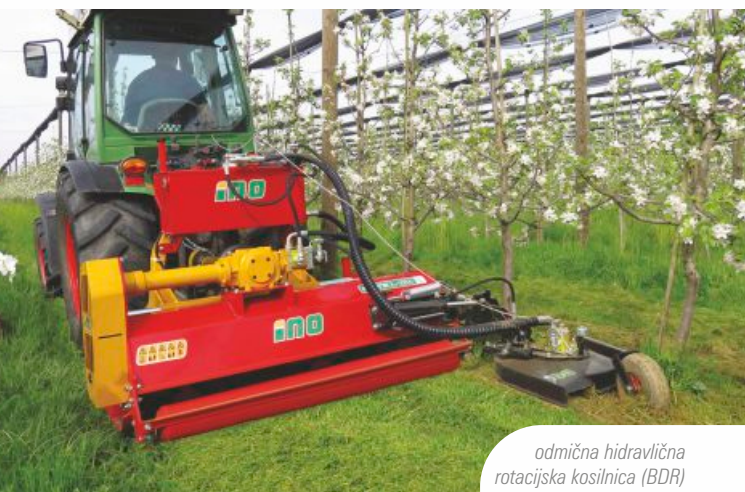
odmična hidravlična rotacijska kosilnica (BDR)